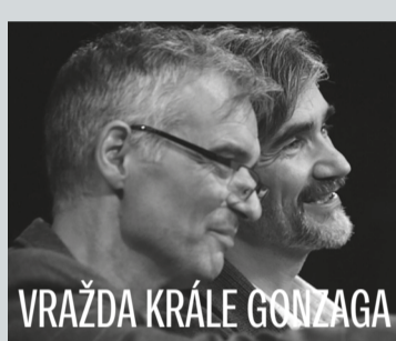
VRAŽDA KRÁLE GONZAGA