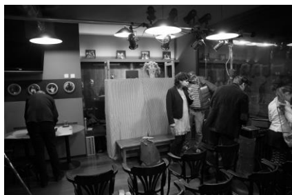
Příprava inscenace Maso v baru DD