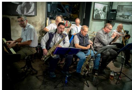
kapela Swing Cabaret