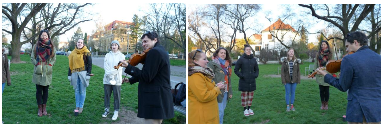
Zkoušky během lockdownu