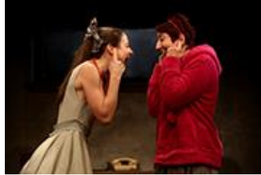
Veronika Kubařová a Simona Babčáková