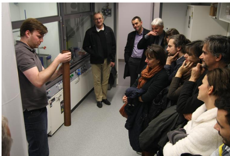
Zástupci DD při prohlídce laboratoře ve VÚCHaB