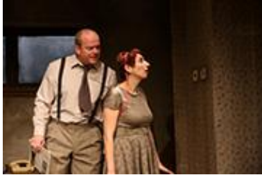
David Novotný a Simona Babčáková