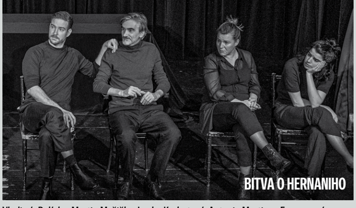
BITVA O HERNANIHO