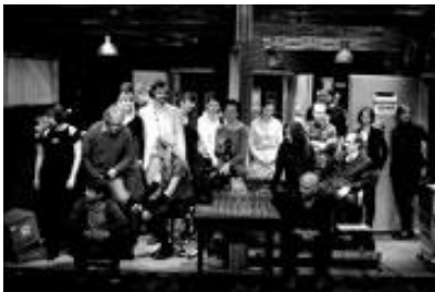
Tvůrci inscenace po premiéře